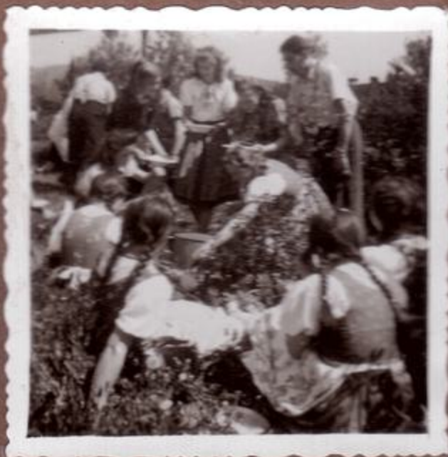
k obědu držková polevka