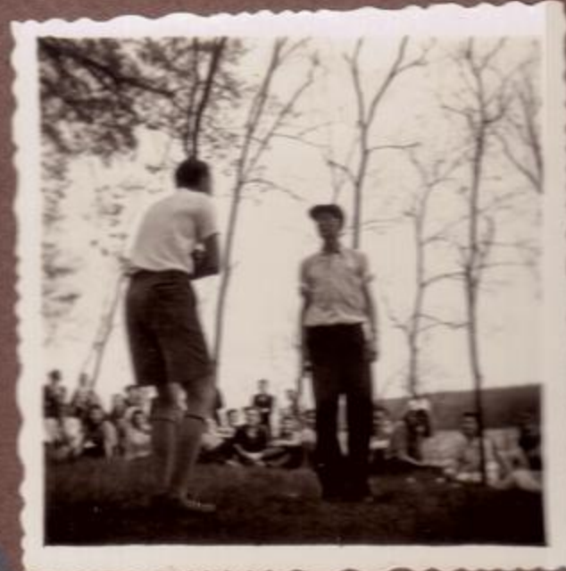
PLZEŇ - VÝCHOD